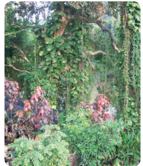
Tropische Flora ist charakteristisch für die äquatornahe Insel.

Diese Vielfalt auf kleinem Raum – Sri Lanka ist gerade mal so groß wie Bayern – macht die Insel zum idealen Reiseziel. Straße und Schiene führen in die entlegensten Winkel, ob in die