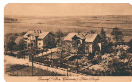
Merkur-Schacht in Gersdorf von der gehobenen Wohnkultur, die man dem technischen und kaufmännischen Leiter des Werkes zugestand. Ansichtskarte um 1922.

② Die gediegene und bis ins kleinste Detail durchgearbeitete Innenausstattung lässt der Blick ins Speisezimmer erkennen. ③ Noch heute zeugen die beiden Direktionswohnhäuser am Pluto- und