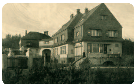
① Zum „Huthaus“ hieß es 1912 in „Deutsche Kunst und Dekoration“: „Das Huthaus tritt ganz als Kind des Erzgebirges auf; mit seinem Schiefergiebel, der das bergmännische Zeichen trägt, dem Mansardendach und dem durch einen Torbogen angeschlossenen Nebengebäude, der Hausmeis-